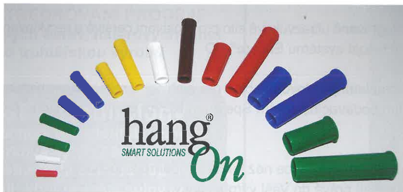
Obr. 3 – Kompletní řada nových rychlých krytek GAQ